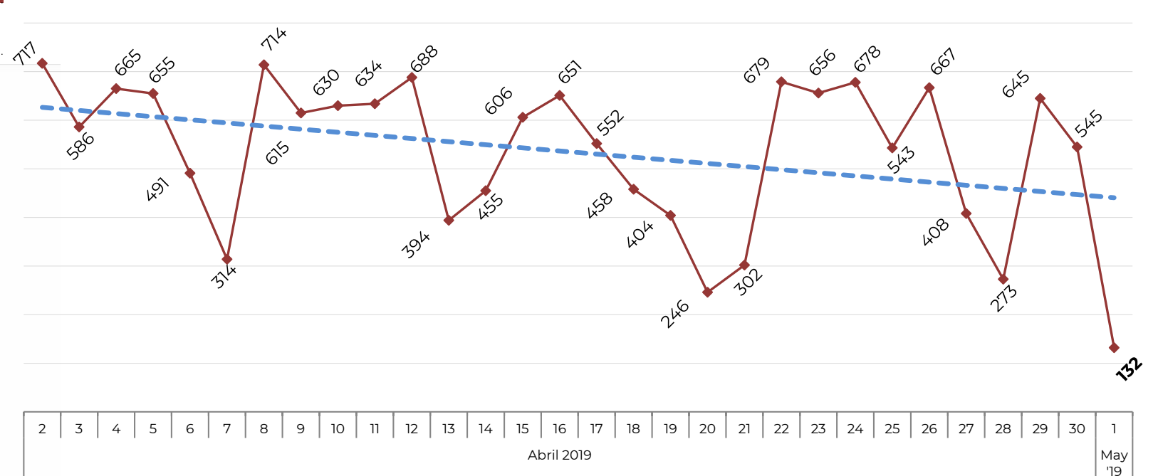
Abril 2019 (Days 2-30) | May '19 (Day 1)