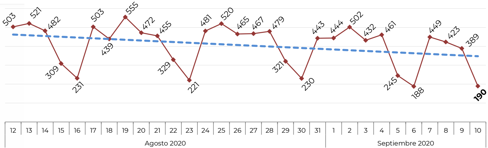
No. de Vehículos Robados (últimos 30 días)