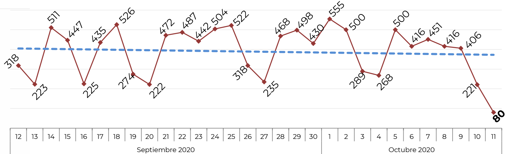
No. de Vehículos Robados (últimos 30 días)